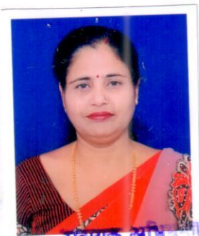
सहायक अभियन्ता ग्रा0 अ0वि0 विभाग मुरादाबाद

अधिशासी अभियन्ता, ग्रामीण अभियन्त्रण विभाग प्रखण्ड मुरादाबाद/रामपुर/बिजनौर/अमरोहा/सम्मल तदानुसार अनुपालन एवं अभिलेखार्थ प्रेषित।